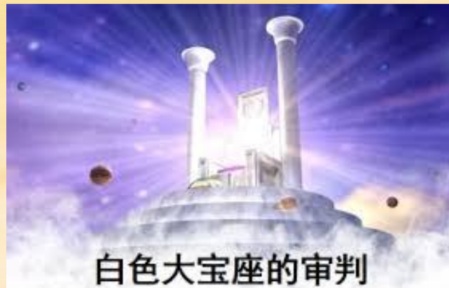
白色大宝座的审判